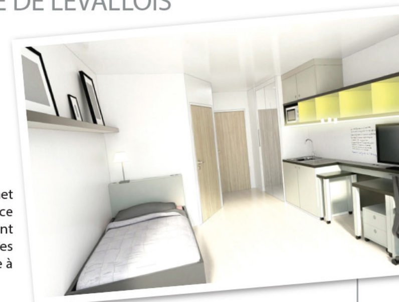
Studio type, meublé.

Seront proposés aux futurs locataires, hall d'accueil Lounge , cafétéria, laverie, salle de fitness , espace de co-working , salon TV, local à vélos et connexion internet WIFI.