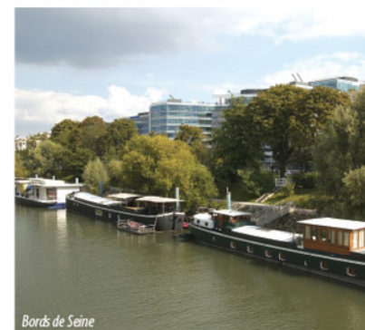
Bords de Seine