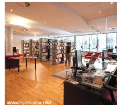
Médiathèque Gustave Eiffel