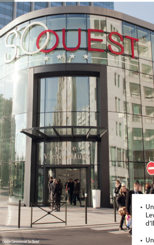
Centre Commercial So Ouest