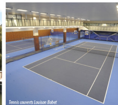
Tennis couverts Louison Bobet