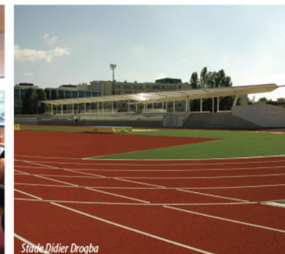
Stade Didier Drogba