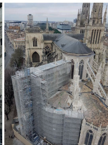
33 - BORDEAUX - Cathédrale Saint André

MAÇONNERIE ★ PIERRE DE TAILLE ★ GROS ŒUVRE RESTAURATION DU PATRIMOINE ET MONUMENT HISTORIQUE