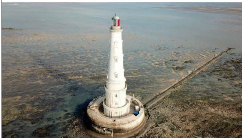
33 - LE VERDON SUR MER - Phare de Cordouan