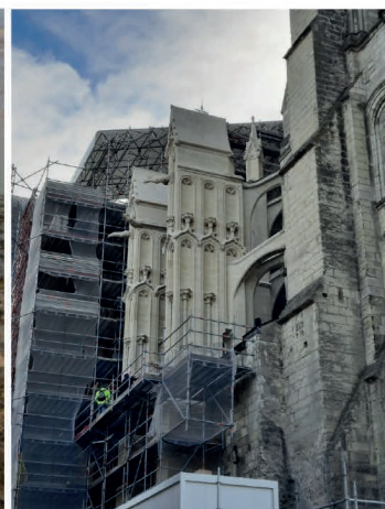
37 - TOURS - Cathédrale Saint Gatien